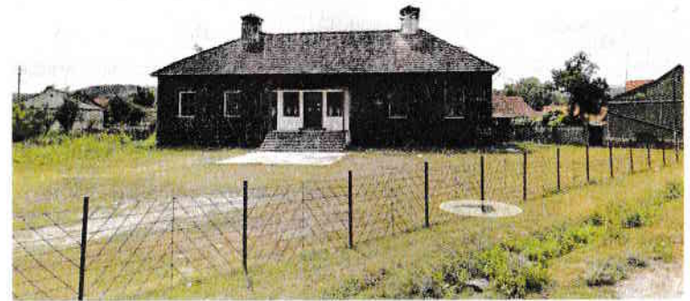
Casa lui Gheorghe Ioanovici, sat Duleu, Fârlug, Caraș Severin.

decedând în 1824, iar mama în 1835), acesta a urmat școala elementară și liceul în Timișoara. Sprijinit de rude și beneficiind de o avere considerabilă, și-a continuat studiile de filozofie și drept la Seghedin, Pojon (Bratislava) și Pesta, finalizându-le în 1842, la vârsta de 21 de ani, când a devenit avocat în Timișoara. Rapid remarcat în viața publică a orașului, Ioanovici a publicat articole, s-a implicat în cercurile sociale și politice, dobândind o popularitate considerabilă. În 1847-1848, a fost ales deputat al Timișoarei în Dieta din Pojon.